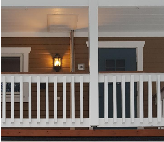
Luke og rømningsstige, sett fra bakken.