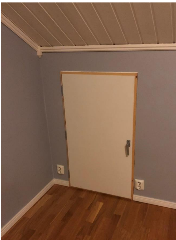
Rømningsdør fra soverom loft, ut til kaldloft over inngangsparti.

Se bilder under for utførelse (det vil monteres belistning rundt rømningsdør).