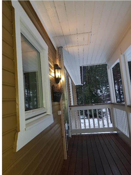
Luke og rømningsstige sett fra trappen.